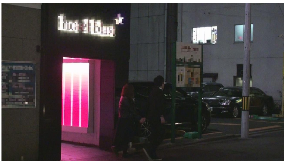
ラブホテルから出て来る㊦と㊧②

調査員はここで事務所に連絡を入れ状況を報告する。 そして協議の結果、本日の調査を終了する。