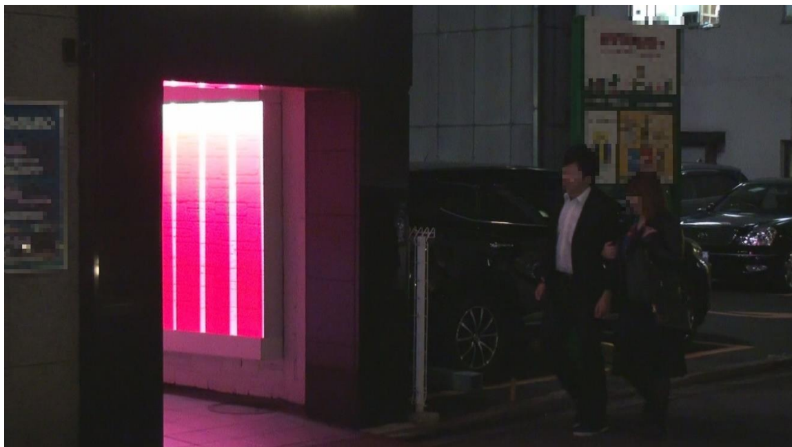
ラブホテルに入る㊟と㊿①