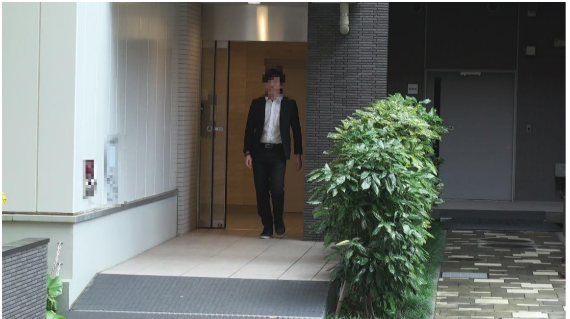
㊦宅マンションから出て来る㊦